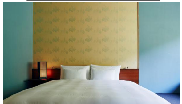
〔宿泊施設での伝統産業製品の導入事例〕 唐紙をあしらったベッド背面のアクセントクロス