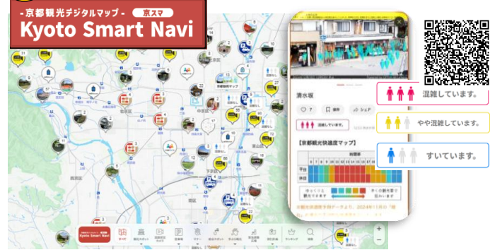
(京都観光デジタルマップ)

「AI技術を活用した新たな観光案内の試行実施」及び「京都観光デジタルマップを活用した情報発信の更なる強化」