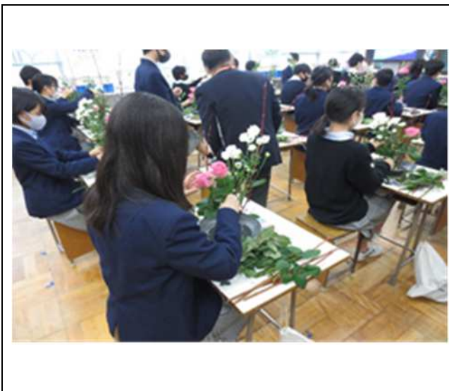
小・中学生による伝統文化体験