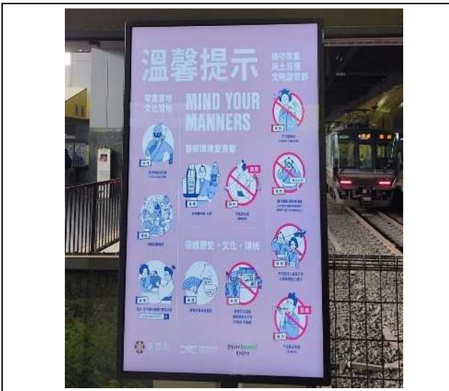
地域の実情に応じたマナー対策等の強化