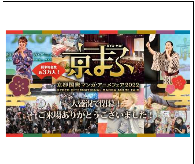
京都国際マンガアニメフェア(京まふ)