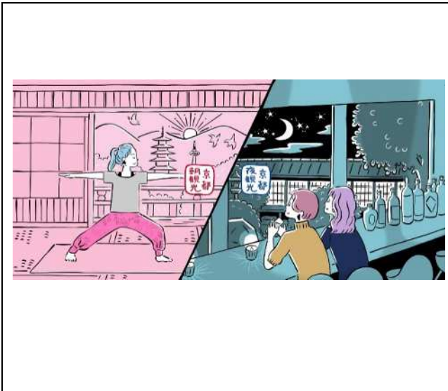
朝・夜観光など幅広い京都の魅力向上