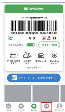
①ファミペイアプリを立ち上げ