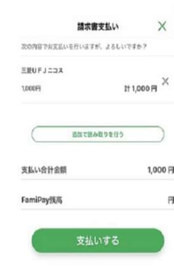
④支払いを選択しFamiPayでお支払い