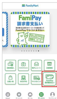
②FamiPay請求書支払いをタッチ