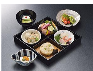
京料理ランチ（一例）