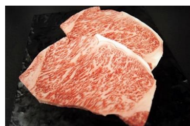
京都肉サーロイン（一例）

詳細はこちら https://www.furusato-tax.jp/city/product/26100