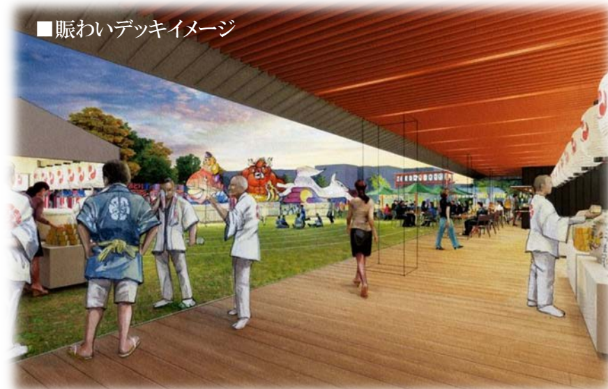
■賑わいデッキイメージ