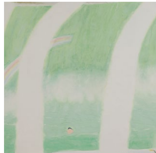
優秀賞 堀花圭「One day -waterfalls-」