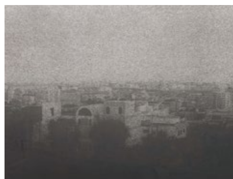
奨励賞・京都市長賞 植田史「影見」