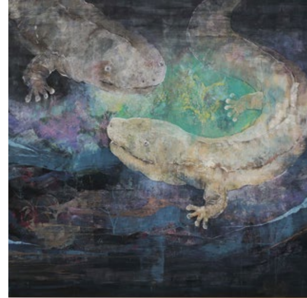
優秀賞 波賀野文子「邂逅」