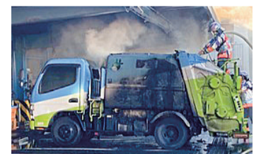
京都市のごみ収集車の火災被害状況