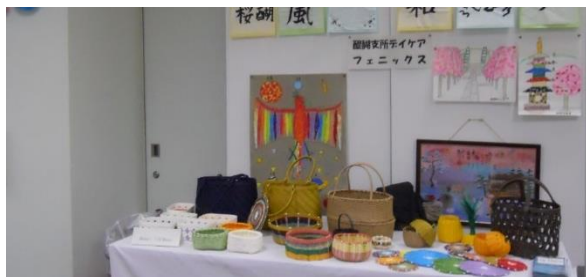
ふれあい作品展の様子