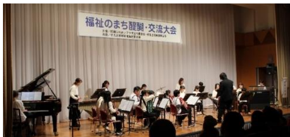
サークル発表会の様子