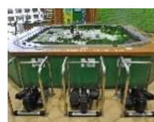
発電体験コーナー

※ 本プログラム当日（12月25日（月））は、無料シャトルバスの運行はありませんので、御注意ください。