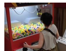
ごみクレーン操作体験