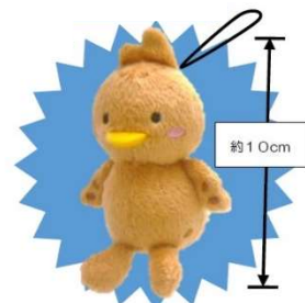
吉兆くんぬいぐるみストラップ