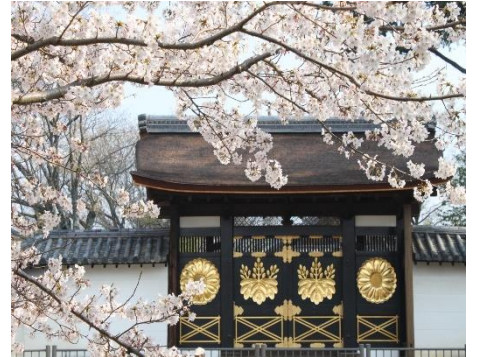
国宝醍醐寺三宝院唐門

寄付をいただいた方は、確定申告を行っていただくことにより、 所得税及び住民税の寄付金控除が受けられます。寄付金控除額の 試算等、詳細については、ホームページをご覧ください。