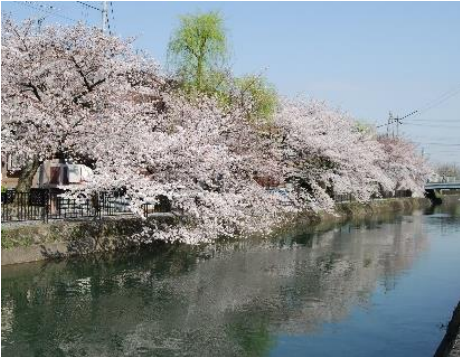
鴨川運河沿いの桜