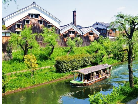
十石舟と酒蔵の町並み