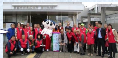
スタッフのみなさまお疲れ様でした。