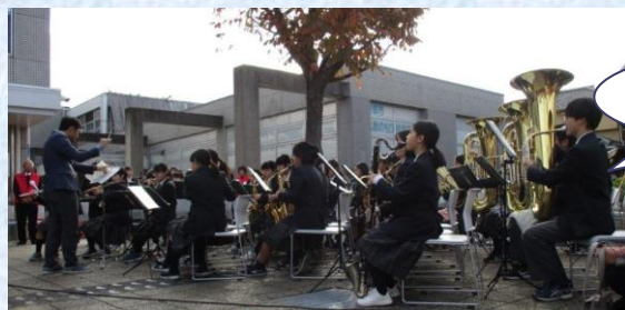
神川中学校吹奏楽部の演奏で開会です！