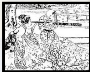
「桃山と望遠鏡」諸国図会年中行事大成

会場に橋南谿の著した、江戸時代の大ベストセラー本『東西遊記』(坂本龍馬をはじめ、数々の貴重な本や資料、講演会での関連資料を展示します。貸出できる資料もありますので、京都市図書館カードをお持ちください。 *参加者に小冊子のプレゼントあり。