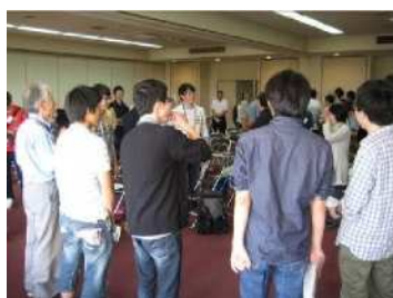
講座での意見交換