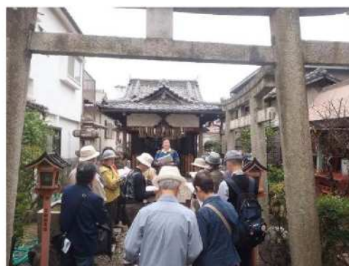
淀地域でのまち歩き講座