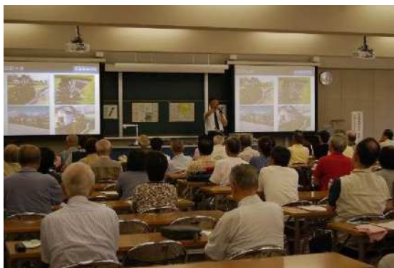
京都聖母女学院短期大学での講座

また、これまでのアンケート結果等を踏まえ、受講者のニーズを講座内容に反映させるとともに、広報もさらに充実を図り、より幅広い層の受講を目指す。