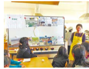
エコネタクッキングの様子

農家で大切に育てられたお米をつかってクッキングしよう! いろいろなお米の食べ方を知ることが出来ます。 日時 2月28日(土)10時～14時 場所 エコロジーセンター 対象 小学生(親子で参加可)。小学3年生以下は要保護者同伴