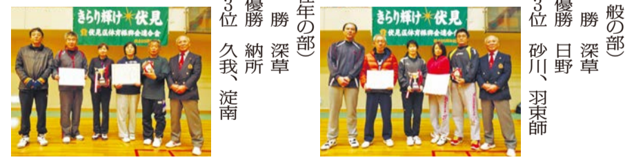
(一般の部) 優勝 深草 準優勝 日野 第3位 砂川、羽束師 (壮年の部) 優勝 深草 準優勝 納所 第3位 久我、淀南

12月14日、横大路運動公園体育館で記念すべき第1回目となる伏見区民ソフトボール大会が開催されました。ソフトボールは、生涯スポーツのひとつで若男女の誰もが楽しめる競技であり今年度から伏見区体育振興会連合会が正式競技として採用されることになりました。第1回目の大会ということもあり、各試合熱戦の対戦が続き、大いに盛り上がったものとなり、一般・壮年の部共に深草体振チームが優勝の栄冠に輝きました。結果は次のとおりです。