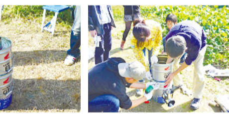
エコキッキング活動の様子