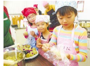
桂川流域クリーン大作戦の様子

日時 2月22日(日)9時～11時 30分(集合8時30分)9時 ※雨天時3月1日(日)に順延 活動区域 桂川上流・下流 集合場所 久我橋右岸橋下、鴨川、羽束師橋右岸橋下、川龍門堰、羽束師橋右岸橋下、宮前橋左岸ランド入口、宮前橋右岸ランド入口、宮前橋左岸ランド入口、宮前橋右岸ランド入口、宮前橋左岸ランド入口 参加人数 50名(小学生以下は保護者同伴) 申込み 「名前・住所・電話」をFAXにて淀川管内河川レンジャー事務局へお送りください。(FAX 611-2271)受付9時～17時。 詳細は、河川レンジャーホームページをご覧ください。 問合せ 桂川流域クリーンネットワーク(仁核) ☎ FAX 611-6006