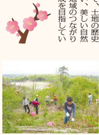
植樹活動は冬に月一回ほどの頻度で行っています。

伏見桃山はその地名が示すとおり、江戸時代には数万人の桃が植えられ一面に桃の花が咲き、奈良県の吉野の桜と比肩されるほどの花見の名所でしたが、現在では桃の木はごくわずかしかりません。「桃源郷プロジェクト」では、地域住民の方々と桃の植樹や管理をとおして、土地の歴史を感じてもらい、美しい自然景観の創出と地域のつながりや連帯感の醸成を目指しています。