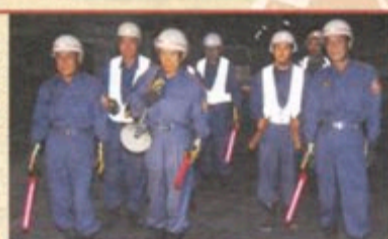
詳しくは、伏見消防署 検索 防火の呼びかけをする砂川分団の皆様

年末防火運動に合わせて、分団器具庫を開設し、巡回広報や夜間パトロールなど地域に密着した防火・防災活動を展開します。 伏見消防団では、一緒に活動していただけの方を募集しています。