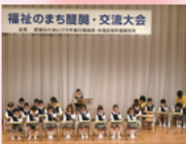
福祉のまち醍醐・交流大会

日時 2月8日(土) 13時30分～16時30分 場所 府総合見本市会館(京都パルスパラザ)稲盛ホール