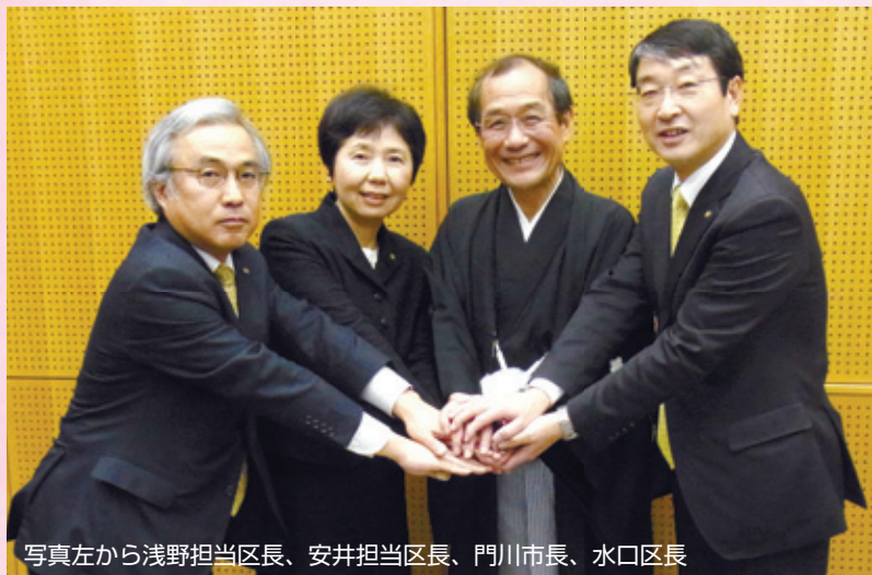
写真左から浅野担当区長、安井担当区長、門川市長、水口区長