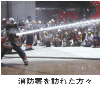
消防署を訪れた方々

伏見消防署では第2回親子の消防フェスタを開催します。お子さまやお孫さんと一緒に、消防車や消防士の装備などにふれて、楽しくお過ごしください。 日時 8月20日(土) 10時～12時 会場 伏見消防署