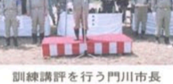
水と灯りのシンフォニーを開催

醍醐地域の自然や環境に関心や愛着を持ち、地域の子どもと保護者や地域の方が交流を深めるため、「第5回水と灯りのシンフォニー」を7月11日(土)午後4時から醍醐支所で開催します。当日は、子ども達がペットボトルと発泡スチロールで作った手づくりの灯籠千個を並べた山科川周辺を散策したり、ステーション体験コーナー、模擬店などでお楽しみいただけます。ぜひ、ご家族をおそろいでお越しください。 主催 伏見東へんり実行委員会 〓市教委生涯学習部(☎251-0470) 〓醍醐支所まちづくり推進課(☎571-6100)