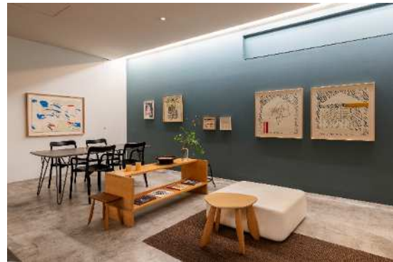
Art Rhizome KYOTO 2025「逆旅京都」会場記録