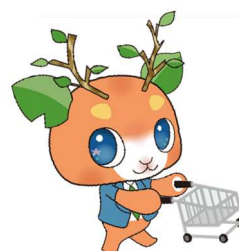
京都市エシカル消費啓発マスコット キャラクター「えしかるん」