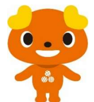
京都生活共同組合オリジナル キャラクター「きょうまる」