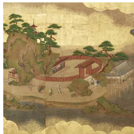
〈黒書院〉帳台の間障壁画 《名所風俗図》（部分）