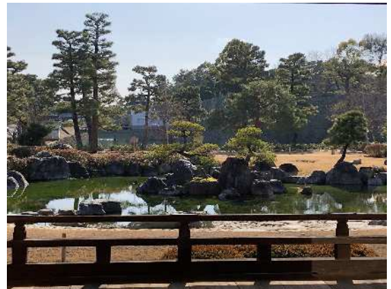
香雲亭から清流園の眺め