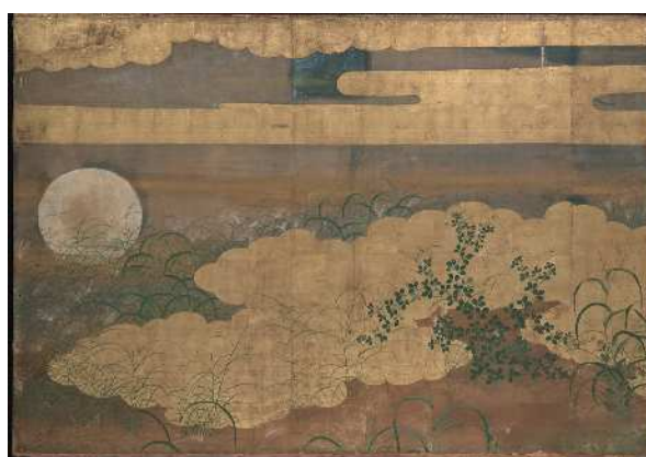
〈大広間〉帳台の間障壁画 《武蔵野図》(部分)