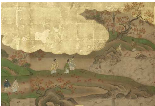
〈大広間〉帳台の間障壁画 《竜田風俗図》（部分）