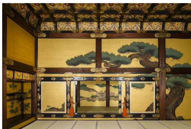
〈大広間〉一の間から帳台の間を見る

イ 内容 〈大広間〉帳台の間を初公開します。帳台の間は、俗に「武者隠し」とも呼ばれますが、将軍が〈大広間〉一の間で対面する際は、帳台構 ちようだいがまえ を通して、この部屋から出入りしたと考えられます。内部は、花鳥図と名所絵で飾られ、名所絵の《竜田風俗図》と《武蔵野図》は、離宮時代(1884～1939)に、京都御所の障壁画が転用されたものです。