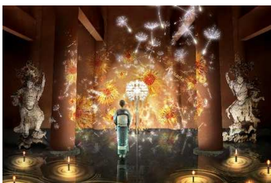
世界遺産・比叡山延暦寺