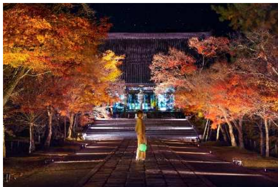
世界遺産・仁和寺