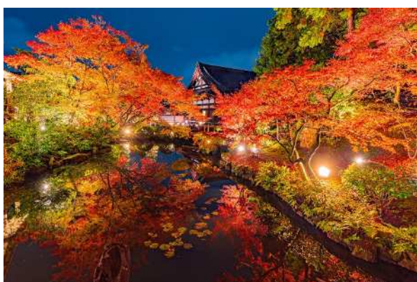
くろ谷金戒光明寺