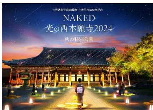
世界遺産・西本願寺

『世界遺産登録30周年・立教開宗800年記念 NAKED 光の西本願寺 2024 秋の特別公開』