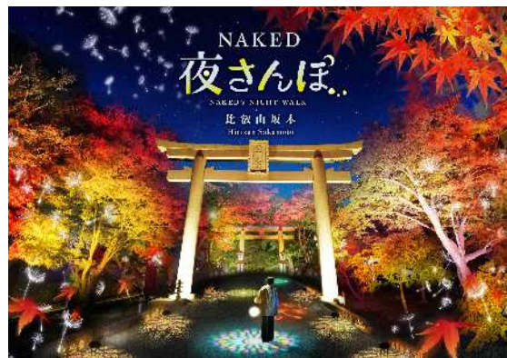
比叡山坂本エリア