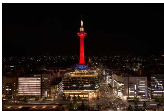
ニデック京都タワー