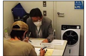
実際の相談の様子