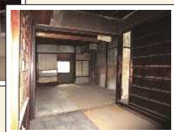
京町家の住宅を賃貸住宅に改修