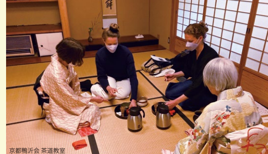
京都鴨沂会 茶道教室

■開催日時: 令和5年10月22日(日) 10:00～15:00(受付時間は9:00～14:30、9:30～献茶式) ■場所: 大聖寺門跡 ■主催: 永皎流白栄会 ■料金: 7,000円 ■定員: 120名 ■問い合わせ先: 大聖寺 Mail: daisho-ji@silk.plala.or.jp