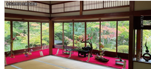
未生流笹岡京都支部展