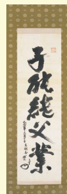
一行「子能継父業」 圓能斎筆 今日庵蔵