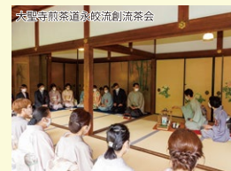
大聖寺煎茶道永皎流創流茶会