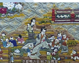
京都鴨沂会紹ぎし教室