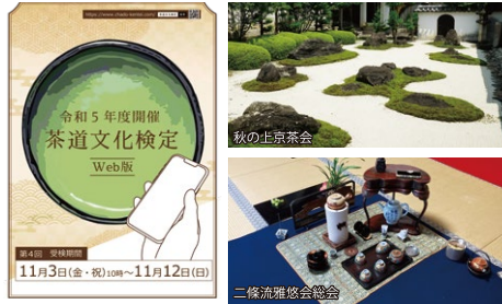
第4回 茶道文化検定 Web版

■開催日時：令和5年11月5日(日) 10:00～15:00 ■場所：大本山 妙蓮寺 ■主催：上京区文化振興会・上京区役所 ■料金：2,000円(前売りのみ) ■定員：1席につき25名程度×10席 ※1席30分の時間指定制 ■問い合わせ先：上京区役所地域力推進室まちづくり推進担当 TEL:075-441-5040