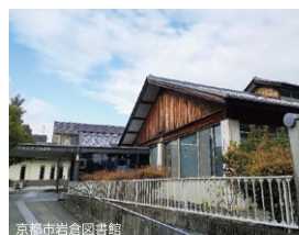
京都市岩倉図書館