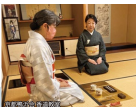
京都鴨沂会香道教室