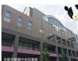
京都市醍醐中央図書館