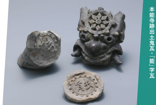
本能寺跡出土土瓦「能」字瓦