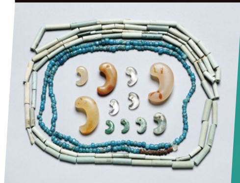
愛宕山古墳出土 玉類