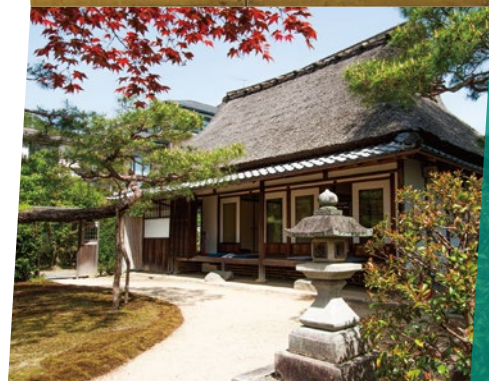
岩倉具視幽棲旧宅