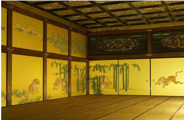
ちくりんぐんこず <遠侍>一の間 障壁画【竹林群虎図】、欄間彫刻

ク その他 今回は、レクチャールームでの解説後、二の丸御殿内で現地解説を行う予定です。