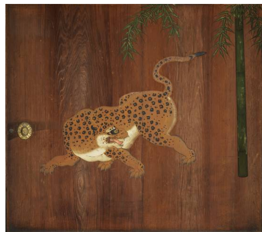
<遠侍>杉戸絵《竹虎図》