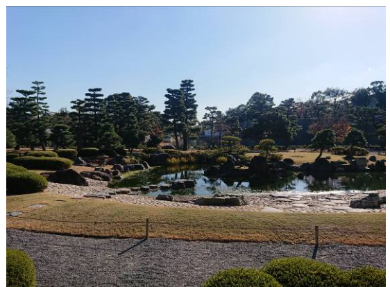
香雲亭から清流園を臨む