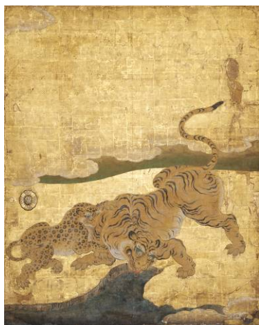
<遠侍>二の間障壁画《竹林群虎図》