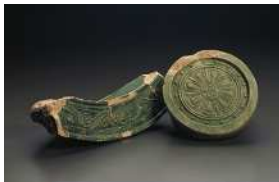
豊楽殿跡出土緑釉瓦

今後25年間の市政運営の理念を掲げた「 京都基本構想 」策定（令和7年12月） 未来に受け継いでいべき京都の本質的な価値・魅力（まち柄）として「歴史と文化の積み重ね」「自然との共生」「人とのつながり」を掲げる。