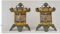
金銅亀甲文透六角釣灯籠