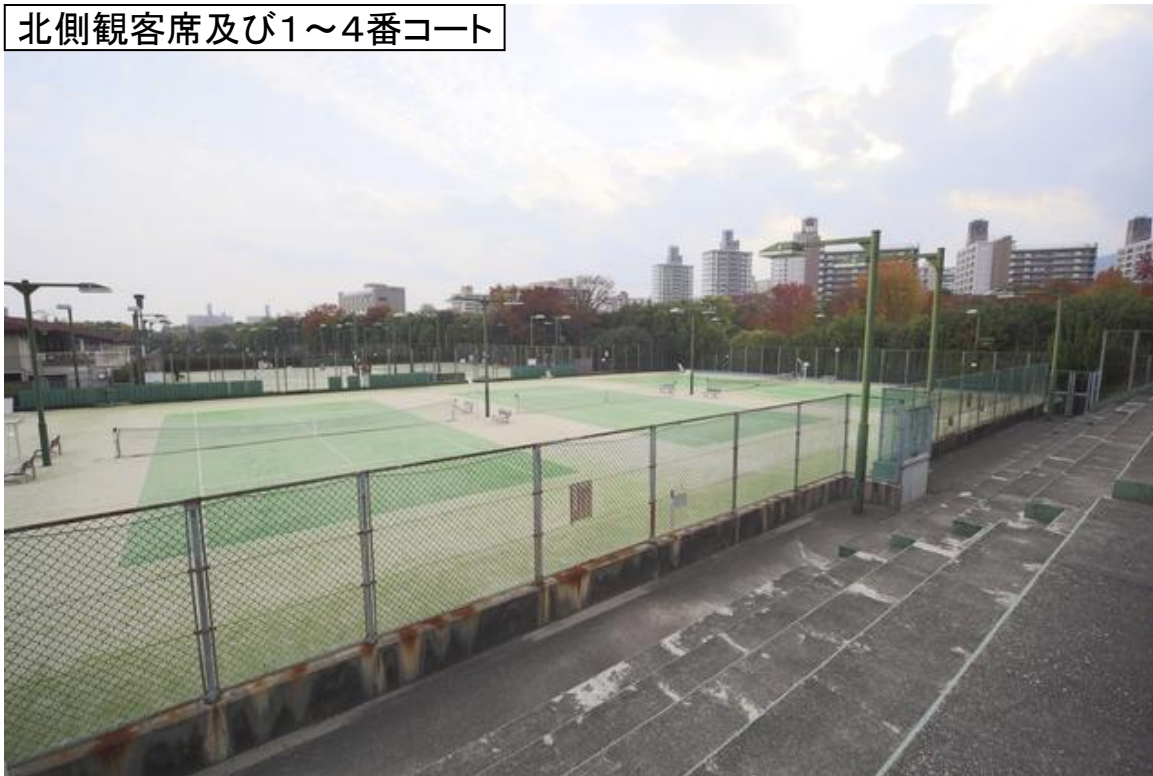
北側観客席及び1～4番コート