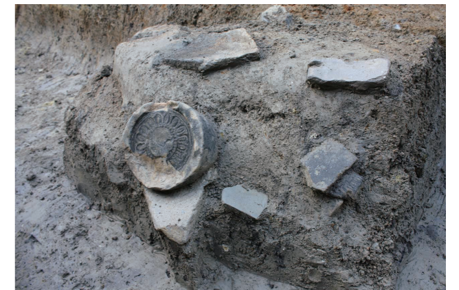
図3 平安時代の瓦出土状況