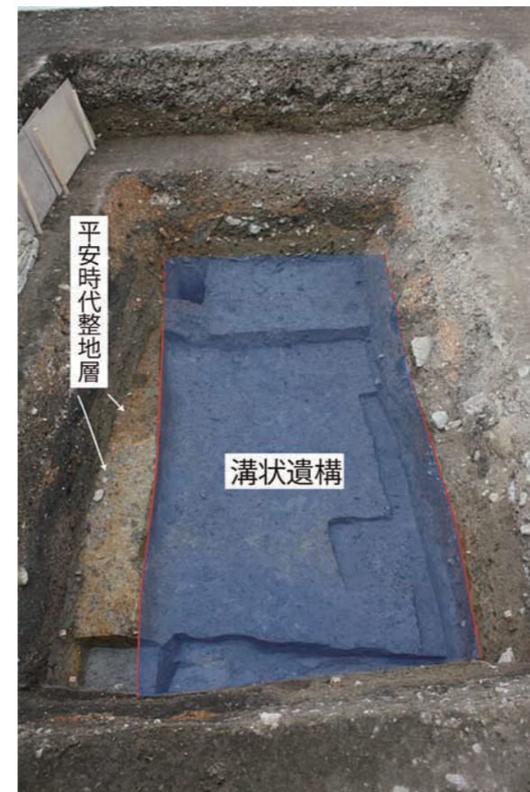
図2 検出状況(東から)