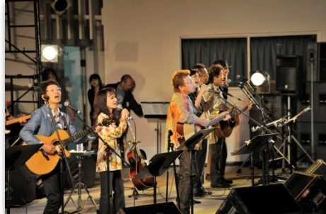
京の旅人フィナーレ