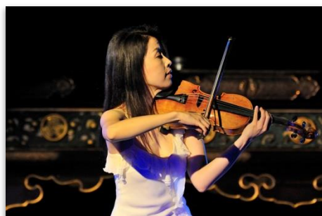
川井郁子ヴァイオリン演奏