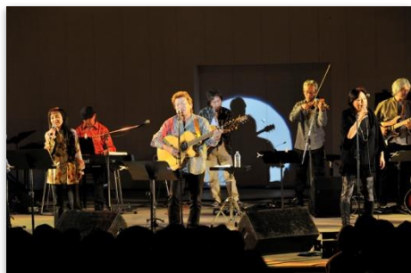
フォークコンサート「京の旅人」