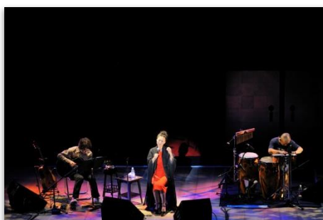
birdアコースティックライブ