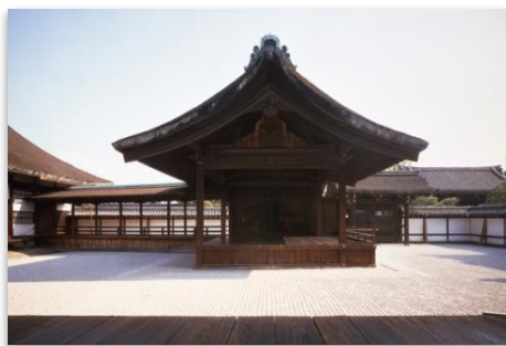
西本願寺 南能舞台