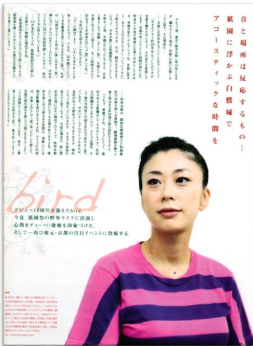
・月刊誌Leaf 11月号 bard氏へのインタビュー