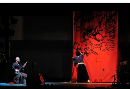
だるま商店ライブペインティング