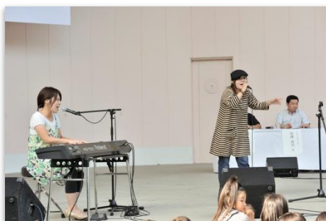
音場小路(審査員特別賞)