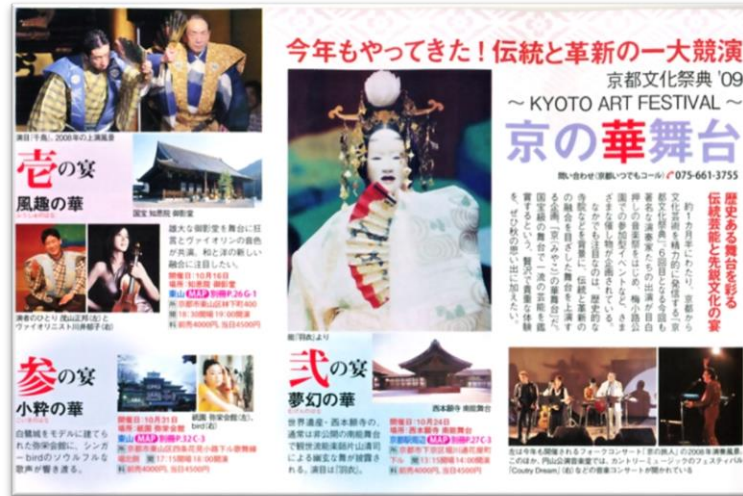
・季刊誌「KYOTO京都」(秋号)