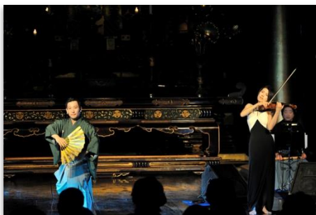
狂言とヴァイオリンのコラボレーション