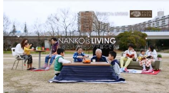
地域住民が自分たちのまちのPRのために作成した まちの魅力発信映像 【コンセプト：まち全体がリビングのようにアットホームな雰囲気のあるまち】 （大阪市住之江区 南港ポートタウン：咲くまちPTによる）