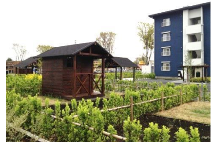
テーマ型住宅事例 (菜園付の賃貸マンション (UR 団地のリノベーション事例))