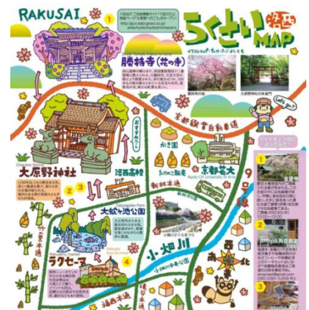
観光プログラム事例例：らくさいマップ （フリーペーパーらくさい）