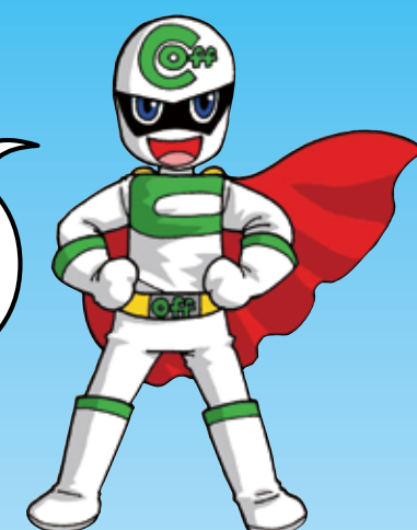
クーリング・オフマン

京都から始めましょう! 買い物や環境のことを考える 「くらし上手」な消費者に なることを