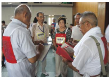
避難所運営訓練の様子

これから梅雨、台風など、雨による災害が心配される季節ですが、いざという時、まず頼りになるのは、地域の皆様同士の支え合いです。京都市では、区役所・支所に防災担当職員を配置し、区役所の防災拠点としての機能を充実させ、地域の皆様とともに地域防災の取組を積極的に進めています。