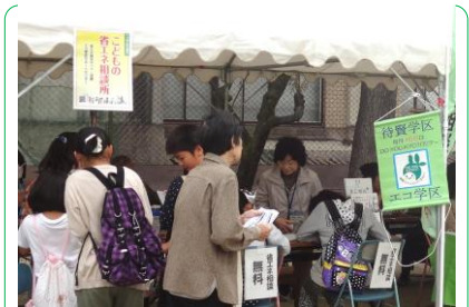
学区で省エネ診断を していただいています

平成26年度は、これまでの物品の支援や学習会の開催支援に加えて、省エネ・創エネなど先進的なエコ活動に意欲のある学区を応援する「エコ学区チャレンジ制度」を創設するなど、引き続き、持続可能な低炭素社会の実現に向けた地域支援を行います。