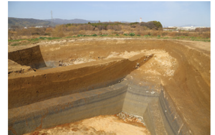
写真6 18区 全景 (南から) 奥に見える石が「埋立地1」の護岸状遺構、手前が「旧木津川」だと考えています。