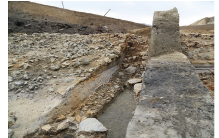
写真4 17区 五間堀南肩修築痕跡 (北から) 砂に埋まった古い時期の護岸が確認できます。