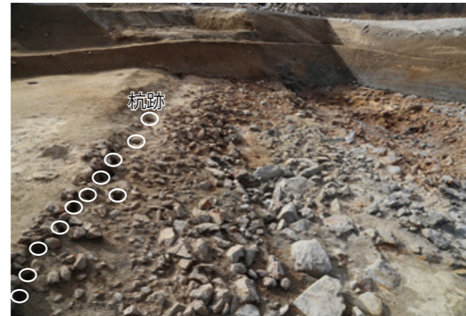
写真3 17区 五間堀南肩護岸と杭跡 (東から) 向かって左側 (石と土の境) に杭が打設されています。