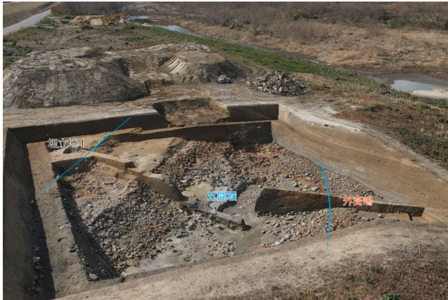
写真1 17区 全景 (北東から)