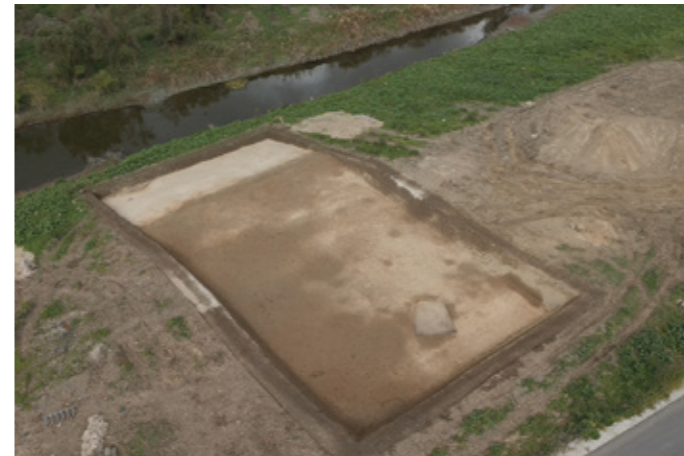
写真5 16区 全景 (南から) 全域で旧木津川が運んだと考えられる砂を確認しました。 旧木津川 (江戸時代) の中を調査したと考えられます。