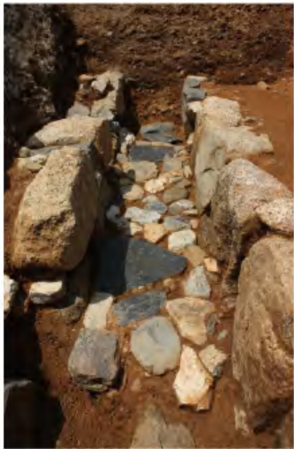
石組溝全景 (南から)