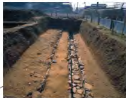
昭和63年度調査全景 (北から)