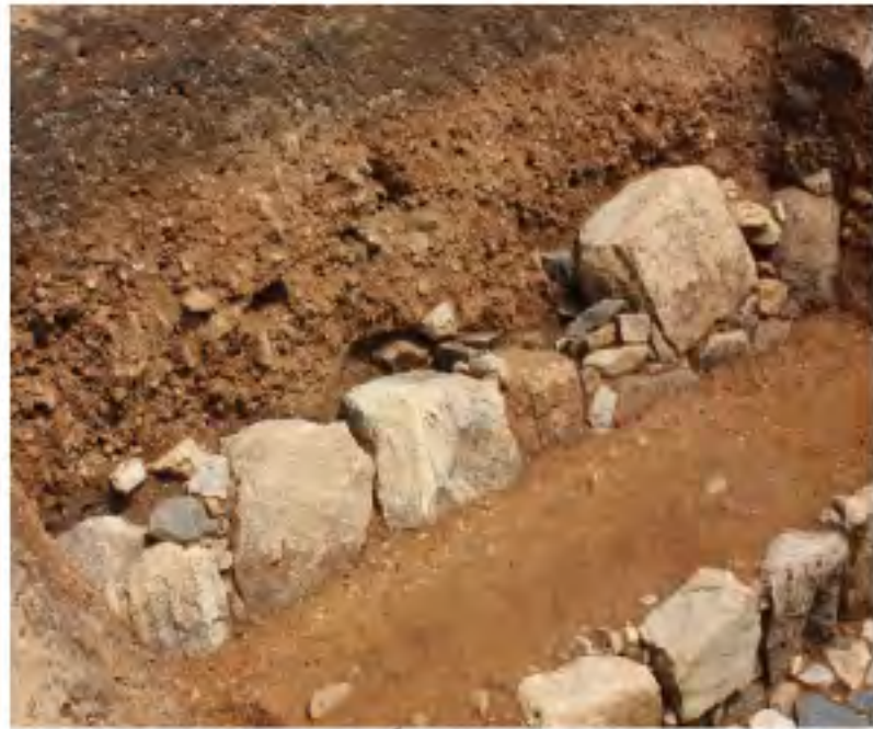
石垣全景 (北西から)