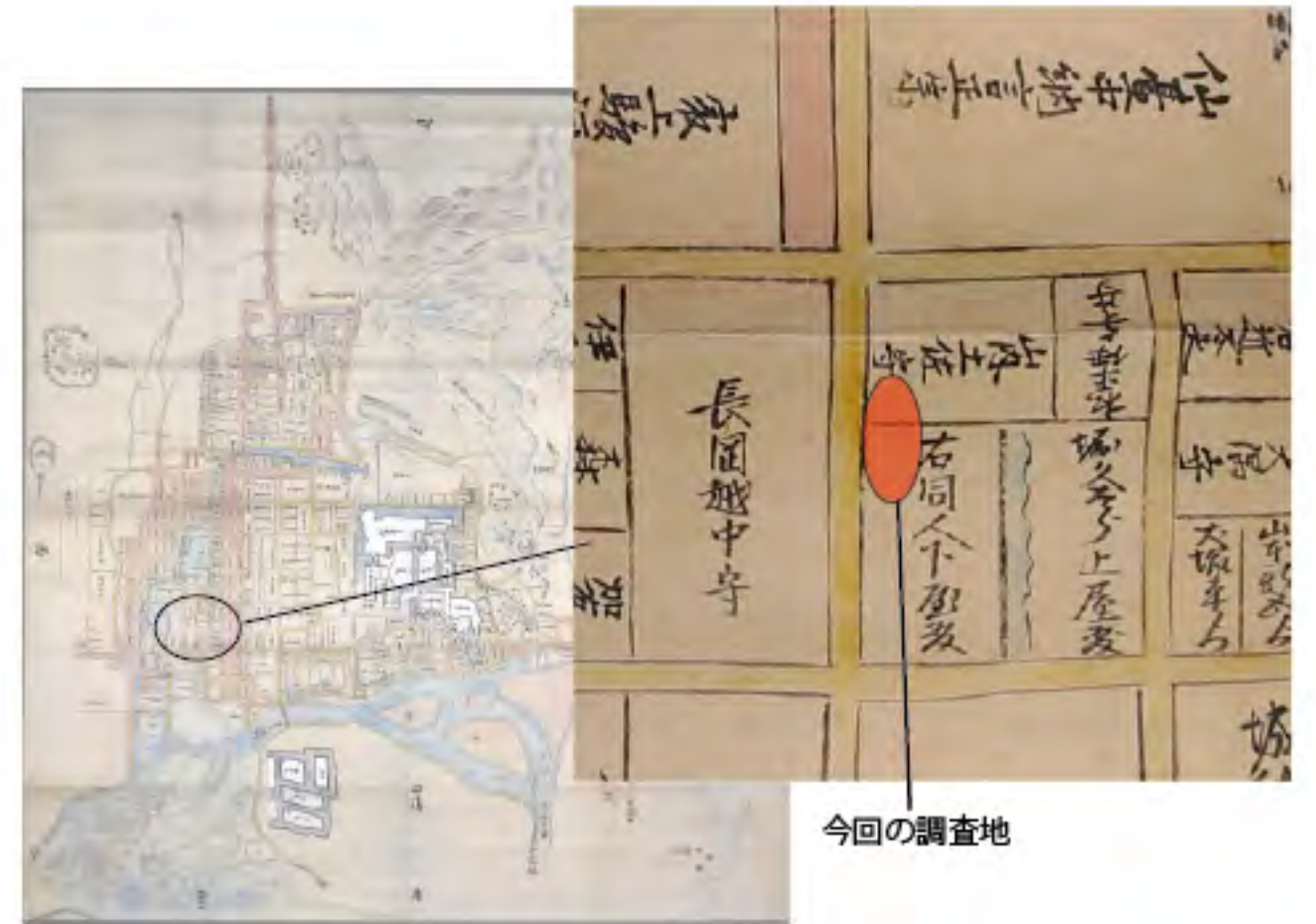
『伏見御城城郭並武家屋敷取図』 京都市蔵