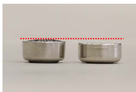
ボタン電池がふくらんでいた