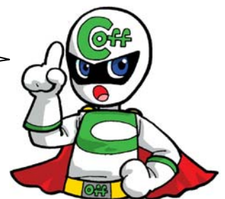
クーリング・オフマン