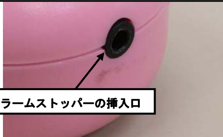
アラームストッパーの挿入口