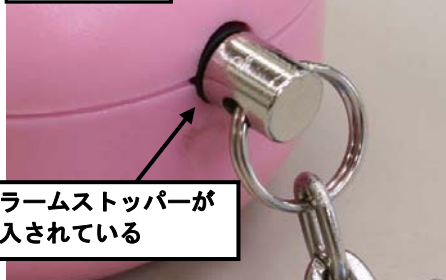
アラームストッパーが挿入されている