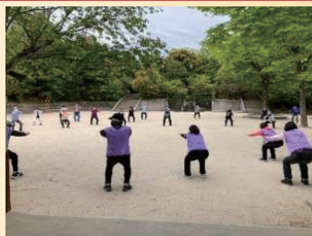
健康体操（カタエちゃん体操）