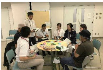
区民の皆さんと計画を策定

ご近所の清掃活動や健康体操、子どもの登下校見守り活動、区民の皆さんによる運動会など、多くの取組が「北区基本計画」を推進させるとともに、区民お一人お一人が“つながる”ことにより、お互いに支え合い、活力を持っていきいきと暮らせるまちを目指しています。