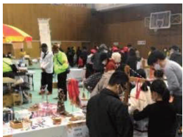
区民交流イベント

地域活性化を目的に、子どもからお年寄りまで、多くの区民の皆さんが交流いただけるよう「北区民ふれあいまつり」の開催や、北区の魅力溢れるスポットを散策する「北区魅力再発見事業」等を実施しています。