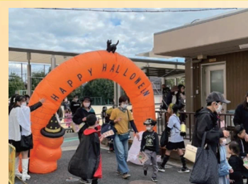
子ども向けのお祭り