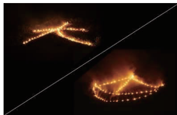
五山の送り火「左大文字」と「船形」