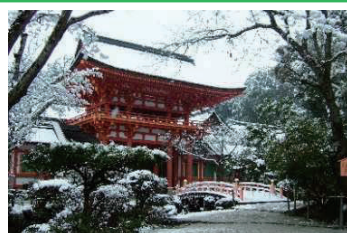
世界遺産の上賀茂神社

そして、歴史や自然、文化が調和した環境の中で、老若男女問わず、区民の皆さんが自然に“つながる”豊かな地域性が、北区の一番の魅力です。