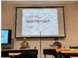
講座の様子。オンライン受講も可能です。

日本人が古くから大切にし、時代を超えて磨き上げてきた「日本のこころ」を次世代に継承することを目的に、佛教大学オープンラーニングセンターと連携し、北区ゆかりの文化人を講師とした連続講座を開講しています。