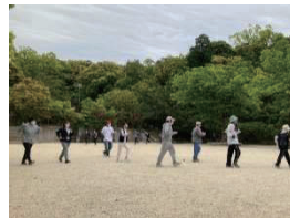
「ゆっくり歩き」と「さっさか歩き」を交互に繰り返すインターバル速歩

※ インターバル速歩 ® は NPO 法人熟年体育大学リサーチセンターの登録商標です。