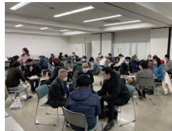
対面のワークショップも開催しました。

地域で実施されている活動と関わりが持ちづらい世代の方々が、北区にまつわる人や情報と“つながり”を持てるようにオンラインネットワークを構築しています。お気軽に参加いただき、人や情報とつながってみませんか？