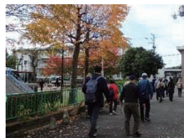
まち歩きイベント