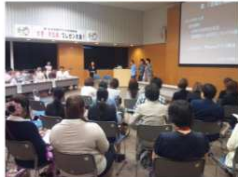
プレゼン大会等の様子