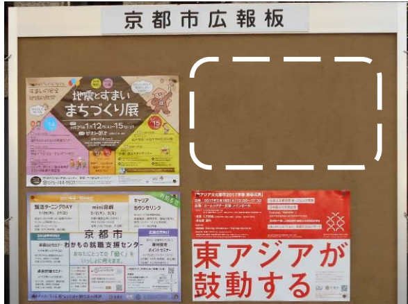
(京都市広報板へのポスターの掲示例)