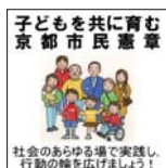
子どもを共に育む 京都市民憲章 社会のあらゆる場で実践し、 行動の輪を広げましょう!