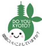
DO YOU KYOTO? 笑顔いいことしていますか?