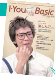
区役所・支所の地域力推進室、市役所の市政案内所ほかで配布しています。この冊子は、ホームページ(※)でも御覧いただけます。