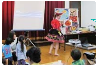
幼稚園で親子一緒にペルー文化に触れる

(公財)京都市国際交流協会 TEL 075-752-3511 京都市国際化推進室 TEL 075-222-3072