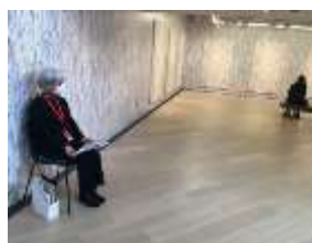
(京都市京セラ美術館)

しかしながら感染症拡大防止の観点から中止となる事業が出てくる可能性もありますので、皆様には随時情報をご提供させていただきます。