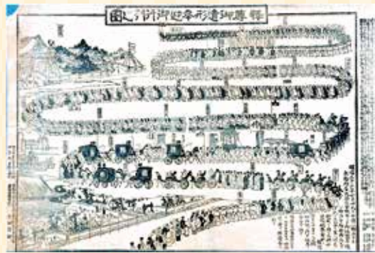
▲ 積尊御遺形奉迎御行列之図(明治33年)