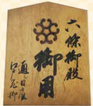
▲ 六条御殿鑑札(安政2年)