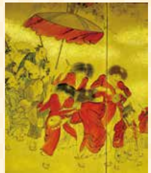
▲ やすらい祭図屏風