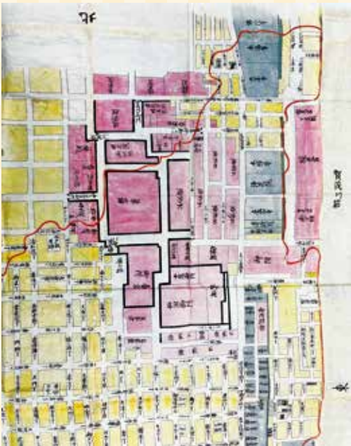
▲ 京都大火絵図(宝永5年)

当館では、これまでも幾度か館蔵品展を開催して、これらの貴重な資料を紹介して参りました。今回は「京歴的京都案内」と題しまして、有名であったり、派手な名所ではないけれども、あまりよく知られていない「京都」の一面を探ることのできる資料を中心として紹介します。歴史を積み重ねてきた「京都」の多様な姿を垣間見ていただければと思います。