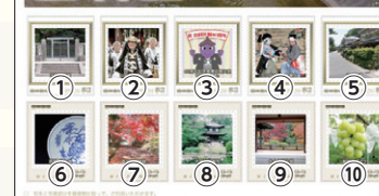
▲切手デザイン (山科の魅力を集めました)