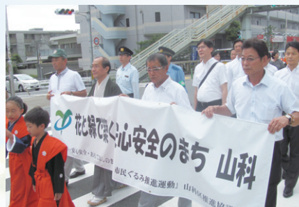
▲三条通でのパレードの様子(構成メンバー(45団体)から約500名のご参加をいただきました)

山科区では、犯罪件数の減少(抑制)などを目指し、取組の指針「花と緑で築く安心安全のまち山科」を本年3月に策定し、区民の皆様とともに、地域の課題に応じた効果のある取組を進めていくこととしています。7月3日、その幕開けとして、京都薬科大学で出発式を開催しました。出発式では、今後新たに取り組む事業の説明、山科子ども歌舞伎塾による「安心安全決意表明」のほか、三条通での啓発パレードなどを実施しました。この出発式を契機に、関係団体や、警察、消防署などとの連携のもと、「犯罪のない、安心して暮らせるまち山科」の実現に取り組んでいきます。