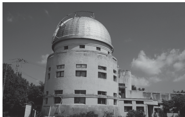
1929年完成の花山天文台本館

山科盆地から北西の方角を望むと、山の頂の上に輝く銀色のドーム。1929年に建設され、日本では2番目に完成した京都大学大学院理学研究科附属花山天文台です。設立当初の建物と望遠鏡が現在も使用され、京都市の「市民が残したいと思う『京都を彩る建物や庭園、』」に認定されるなど、その歴史的価値が注目されています。