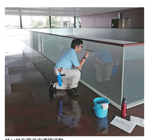
サンサ右京での清掃活動