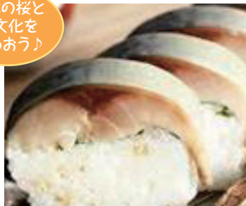
京北の桜と食文化を味わおう!