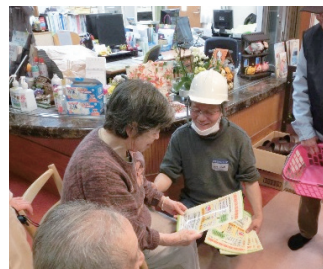
災ボラ訓練(西京極学区)

また、西京極社協では福祉災害ボランティアを組織し、自主的に学習会を積み重ね、12月4日の右京区総合防災訓練に合わせ実施した災害ボランティア設置・運営訓練(災ボラ訓練)では、その力をいかに発揮しました。